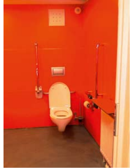
Barrierefreier Sanitärraum