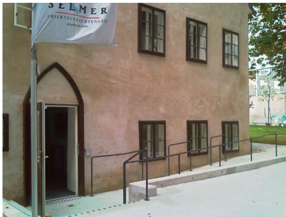
Barrierefreier Zugang zur Heumühle

WC vorhanden. Auch die Bewegungsfreiräume vor der Eingangstür und der Zugang zum WC im Erdgeschoß verfügten nicht über die erforderlichen Durchgangsbreiten, Öffnungsrichtungen und Wenderadien.