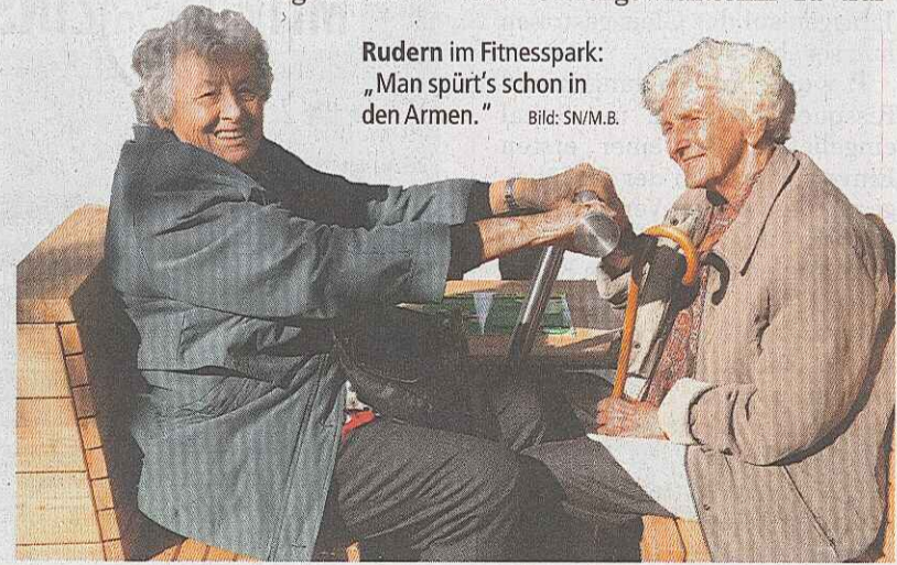
Rudern im Fitnesspark: „Man spürt's schon in den Armen.“

Auf der Balancierstrecke gilt es, den Gleichgewichtssinn zu trai-